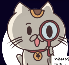
マネロン対策キャラクター マネっこちゃん

金融機関をご利用のお客さま一人一人の情報を確認することで 犯罪収益の移転やテロ資金供与を、防止することができます